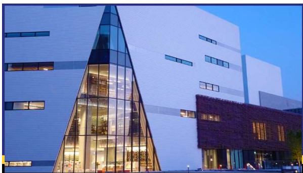
箕面市立船場生涯学習センター