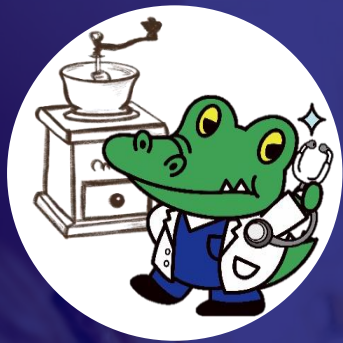
大阪大学 公式マスコットキャラクター 「ワニ博士」